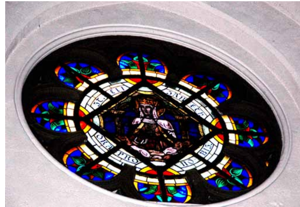
Glasbewerkingsbedrijf uit Brabant werd ingeschakeld om de aanwezige schade aan de ramen in kaart te brengen.

Aannemingsbedrijf Nico de Bont B.V. tel. 073-518 94 80 Postbus 76 fax 073-518 94 90 5260 AB Vught www.nicodebont.nl