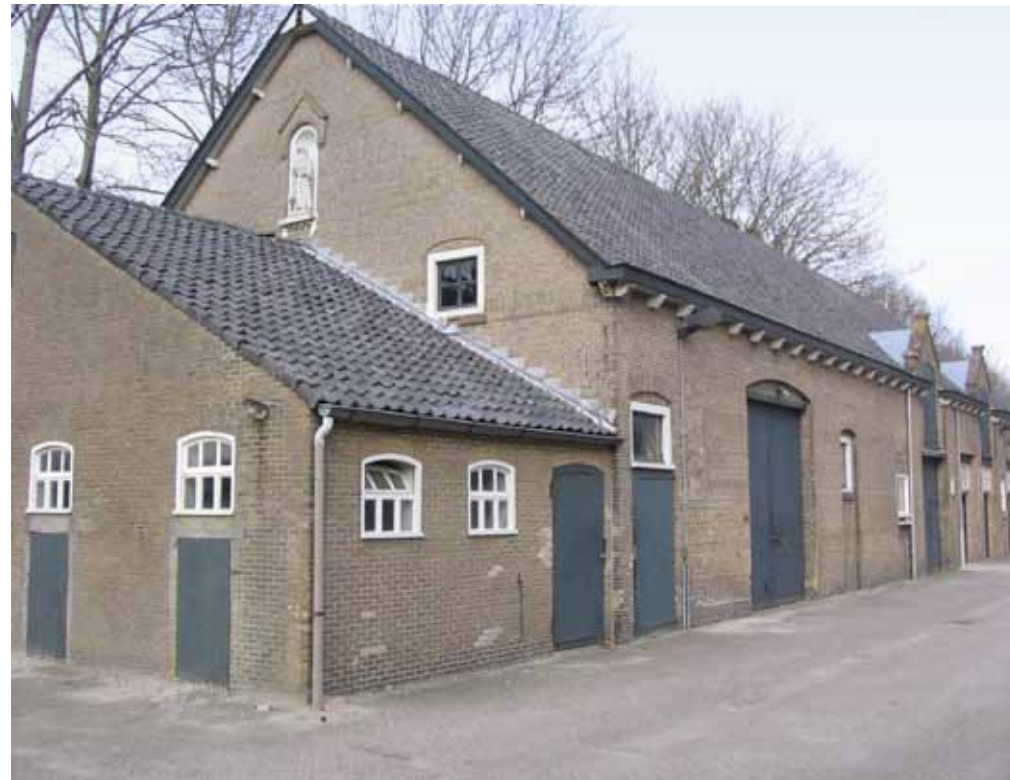
Voor de boerderij bestaan nog geen concrete plannen.