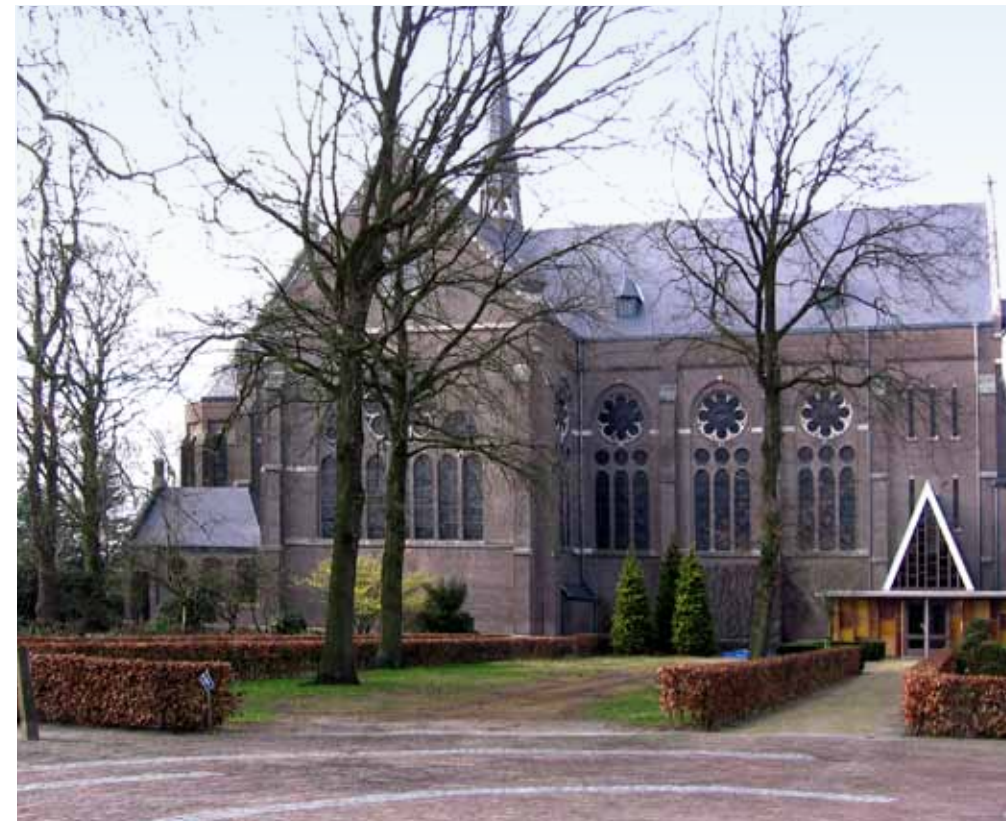
De grote kapel